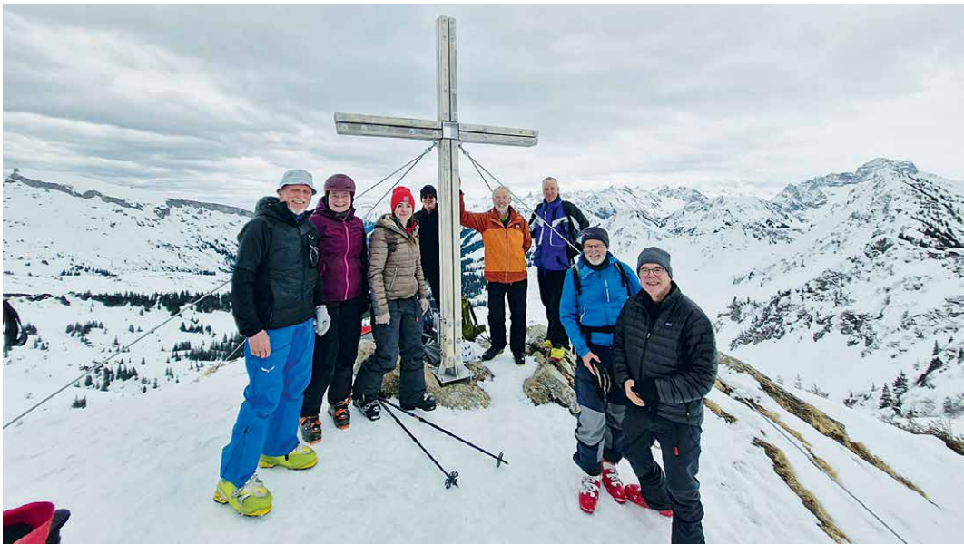
Die Gruppe am Steinmandl Gipfel – zum Bericht auf der rechten Seite